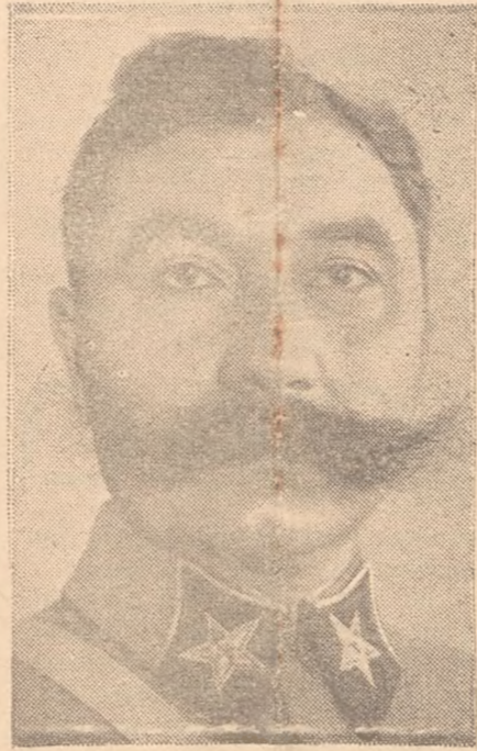
N. A. BULGANIN. Gaf een dag order uit tegen de imperialisten.